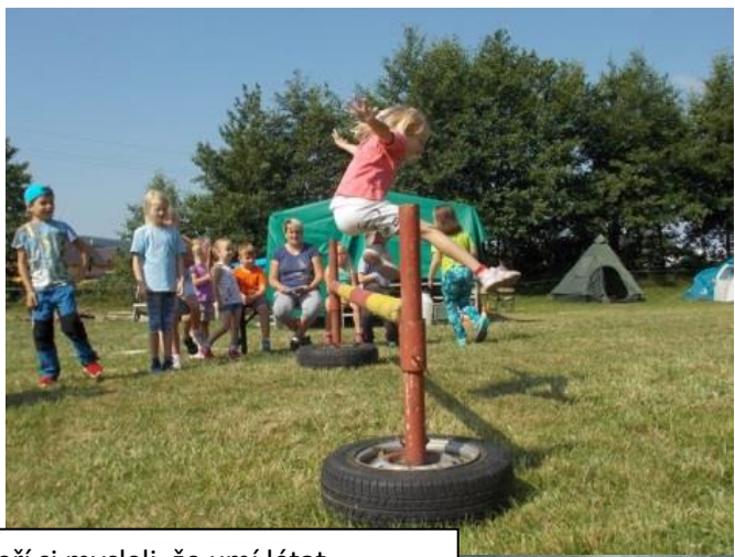
Někteří si mysleli, že umí létat