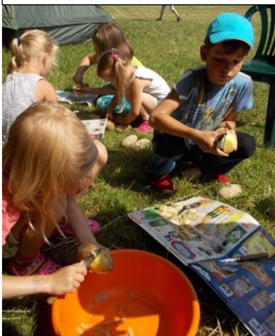
A se kterými jsme společnou silou pomáhali