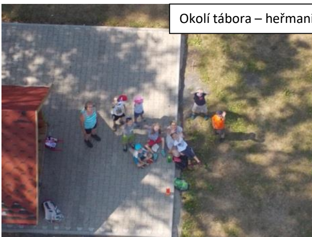
Okolí tábora – heřmanická rozhledna