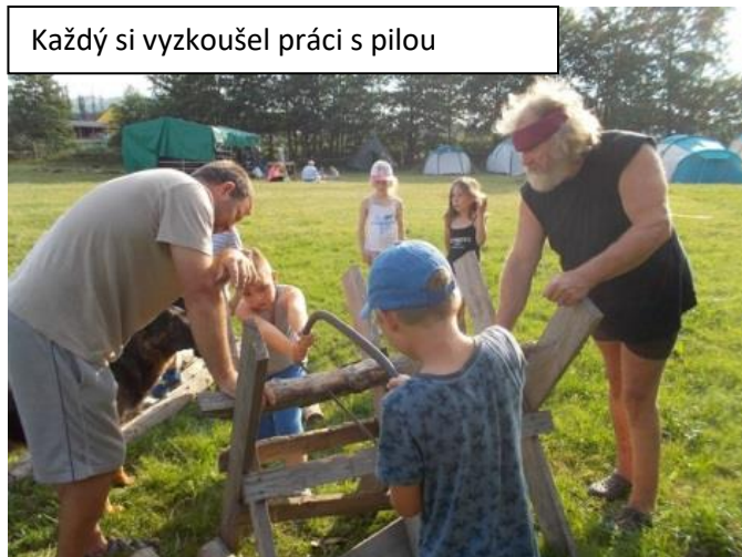
Každý si vyzkoušel práci s pilou