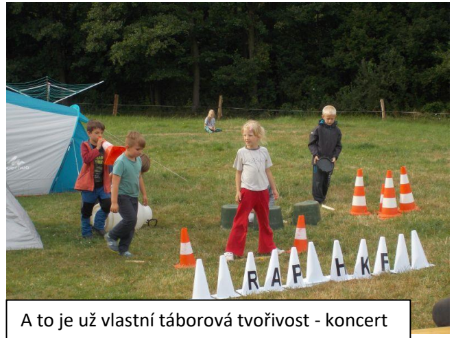
A to je už vlastní táborová tvořivost - koncert