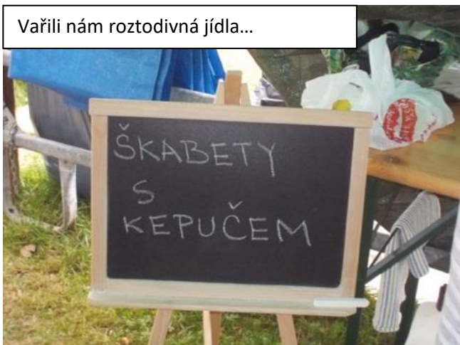
Vařili nám roztočivá jídla...