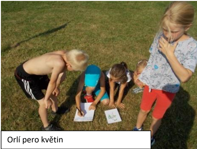
Orlí pero květin