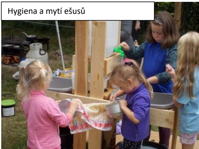
Hygiena a mytí ešusů