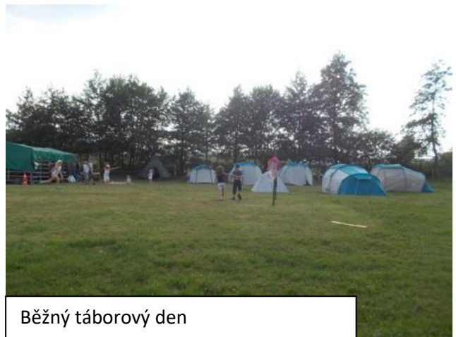
Běžný táborový den