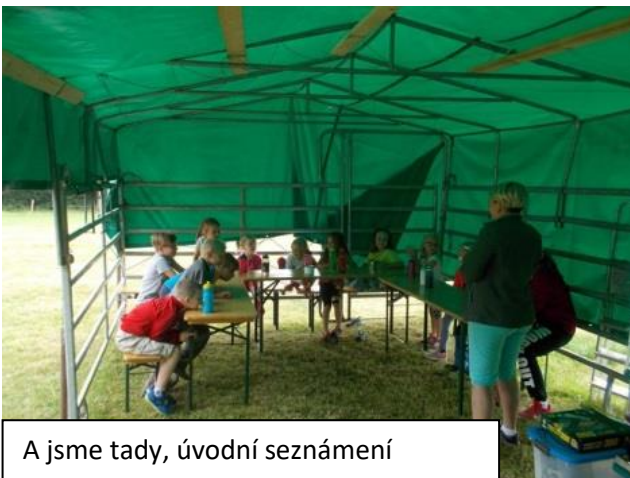
A jsme tady, úvodní seznámení