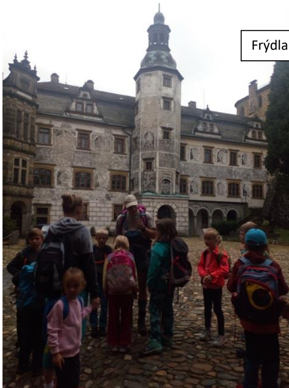
Frýdlant a cesta zpět