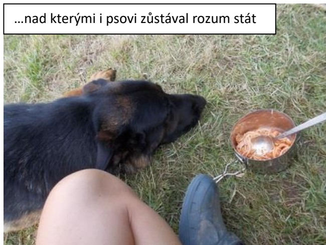
...nad kterými i psovi zůstával rozum stát