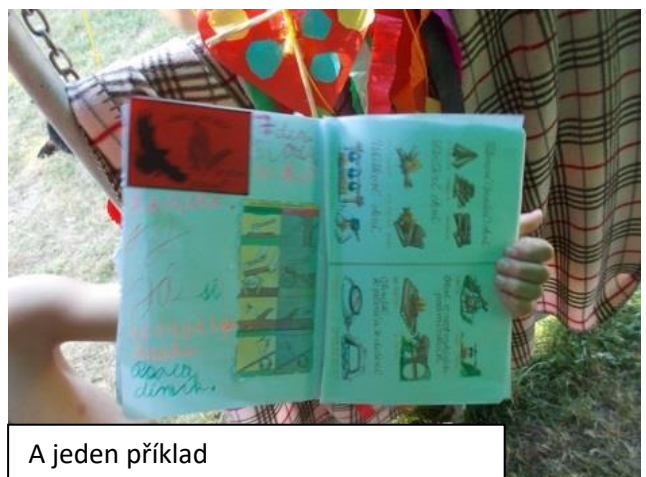
A jeden příklad